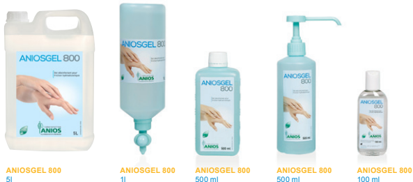
ANIOSGEL 800 5l